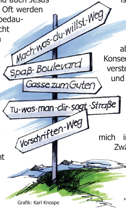
Grafik: Karl Knospe

„Alles ist mir erlaubt!“ Das klingt nach grenzenloser Freiheit und genau das war das Lebensmotto vieler in Korinth. Und was soll daran so verkehrt sein? Freiheit ist doch ein hohes Gut. ... Ja, das ist es und auch Jesus ruft uns in die Freiheit. Oft werden Christen von anderen bedauert, weil sie so vieles nicht mehr dürfen, das Leben sich so einschränkt. Und oft leben wir auch so: Wir strahlen nicht wie freie Menschen eine Freude, Leichtigkeit und Hoffnung aus. Aber Gott ist ein Gott, der die Freiheit liebt. Freiheit, die den Menschen wirklich frei macht! Ich war erstaunt wie viele Gegenteilworte es für Freiheit gibt. Schauen Sie gern einmal nach oder überlegen Sie selbst, welche Worte Ihnen einfallen. „Mama, darf ich...?“ Auch, wenn diese Frage manchmal nach Grenzüberschreitung ruft, so freue ich mich als Mama doch über diese Frage. Ich freue mich, weil sie von einem Vertrauen geprägt ist, was